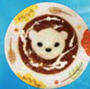
水獭肉丁葱头盖浇饭

南国气息的度假式自助餐厅,让人忘记这里是都市大厦的屋顶。 我们为您备有精彩菜单。 (最后点餐时间:餐厅关门前30分钟)