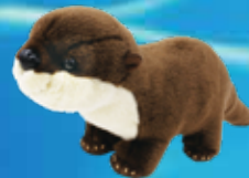
原创 亚洲小爪水獭布制玩偶

店内商品琳琅满目,不仅是孩子们, 就连大人们也都爱不释手。 请将您在水族馆的心跳和回忆带回家