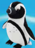
原创 黑脚企鹅布制玩偶