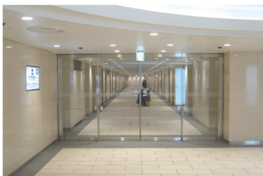
サンシャインシティから東池袋駅への地下通路入口

また、2011年2月には地下鉄有楽町線 東池袋駅まで省エネ対応の地下通路で直結し、更に利便性が増しています。