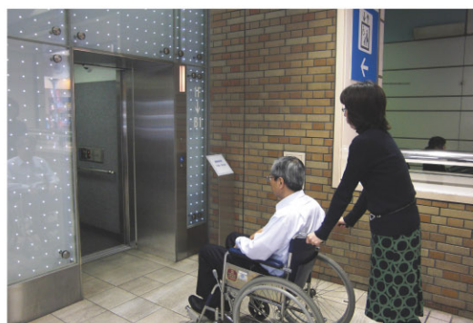
サンシャインシティ入口の身障者対応型エレベーター

また、2011年2月には地下鉄有楽町線 東池袋駅まで省エネ対応の地下通路で直結し、更に利便性が増しています。