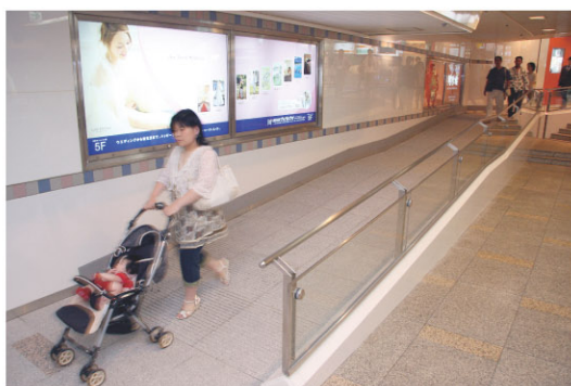
横断地下道のスロープ

当社は、お体の不自由なお客様や小さなお子様にも安心してご利用いただけるよう、設備等の拡充に努めています。どなたでもご利用いただける多目的トイレや身障者対応型エレベーターの設置をはじめ、段差の解消などの改修を進めています。